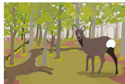
Das Reh erkennt den Hund sofort als Feind.