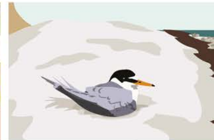
Strandbrüter brüten auf dem Strandwall.