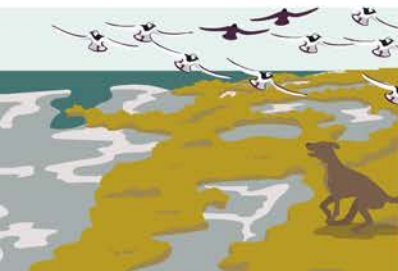
Große Vogelschwärme fliegen panisch auf.