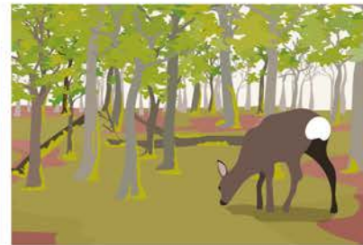
Rehe suchen nach Nahrung.