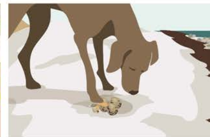
Das ungeschützte Gelege kann zerstört werden, auskühlen oder überhitzen.