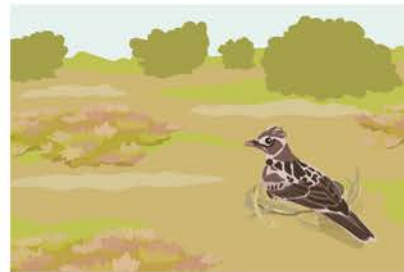
Im Offenland gibt es viele Bodenbrüter.