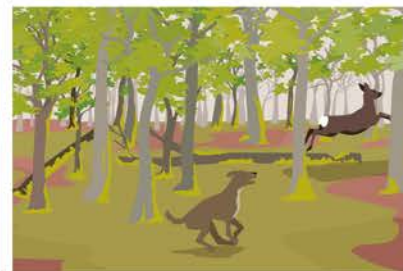
Das Reh versucht zu fliehen und verstärkt damit den Jagdtrieb des hetzenden Hundes.