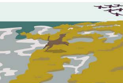
Die Vögel fliegen weite Strecken, bevor sie sich erschöpft wieder niederlassen.