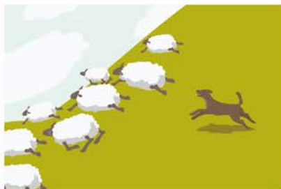
Deichschafe geraten in Panik und rennen unter Umständen in Stachelrahtzäune.