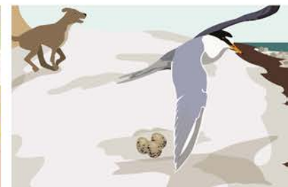
Der Vogel fliegt von seinem Nest auf.