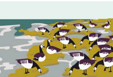
Zugvögel rasten im Deichvorland.