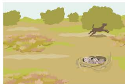
Die ungeschützten Eier kühlen aus, überhitzen oder fallen Nesträubern zum Opfer.