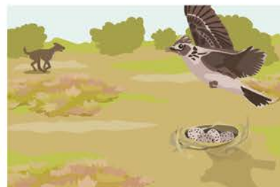
Auch entfernte Hunde schrecken Vögel auf.